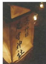
▲竹燈夜で協賛の行燈

“LOVE SANDO!” 山東まちづくり会は、「山東をもっと楽しい魅力あるまちに」を合言葉に活動するボランティア団体です。クラフトフェアや竹燈夜などのイベントでは、多世代の方に楽しんでほしい…貴志川線も使ってほしい…こんな思いから、無料シャトルバスも運行します。しかし、まだまだ未熟な団体。皆様のご支援なしで開催することができません。どうか、活動の趣旨をご理解いただき、ご協賛やご寄付そしてボランティアでのご支援よろしくお願ひいたしますm(__)m